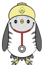
大学キャラクター 「ほいほいさん」

E-mail:hokeniryodaigaku@pref.kagawa.lg.jp