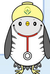
大学キャラクター 「ほいほいさん」

希望者には、在学生や教職員が相談に応じます。入試のこと、教育内容のこと、大学生活のことなど、疑問や不安にお答えします。