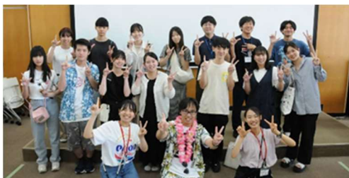
ワークショップのメンバーで集合写真