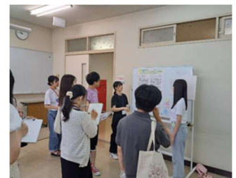
ポスターセッションの様子