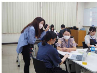
沖縄県立看護大学の先生に助言を頂く様子