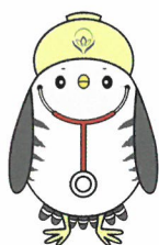
大学キャラクター 「ほいほいさん」

E-mail:hokeniryodaigaku@pref.kagawa.lg.jp